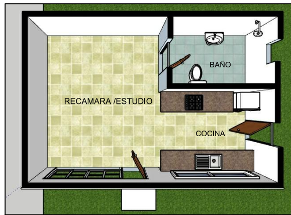
PLANTA ARQUITECTONICA FASE 1 S/E