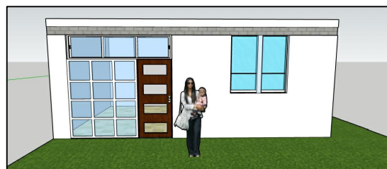
FACHADA PRINCIPAL FASE 1 S/E