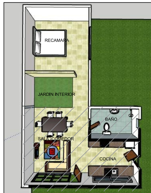
PLANTA ARQUITECTONICA OPCION 2 S/E