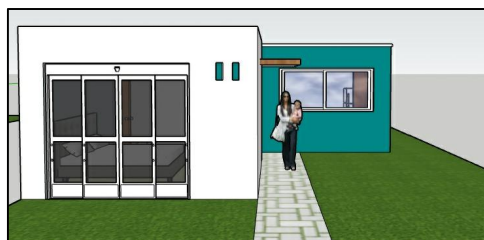
FACHADA PRINCIPAL OPCION 1